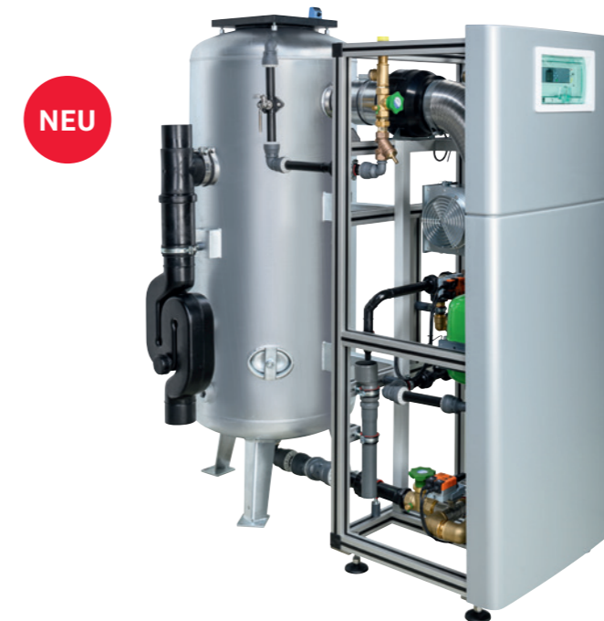
Oxidationsfilteranlage fermalIQ:MA3000 inklusive Frontverkleidung