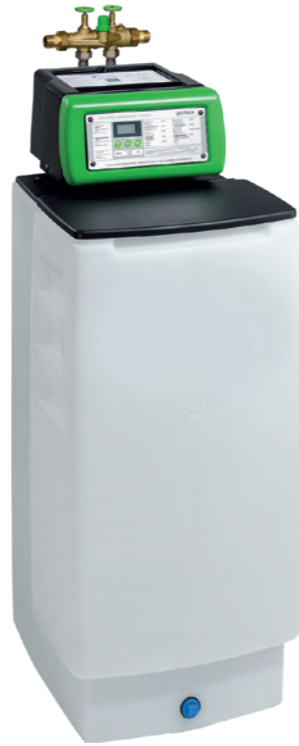
Nitratfilter WINNI-mat VGX-N

Grünbeck verändert Ansichten. Und schafft zuverlässig reines Wasser auf umweltfreundliche Art. Je nach Filterfüllung werden Schmutzstoffe, Eisen- und Manganbestandteile reduziert. Durch eine vollautomatische Rückspülung werden die zurückgehaltenen Verunreinigungen in den Kanal ausgespült. Aktivkohlefüllungen werden zur Entchlorung, Geruchs- und Geschmacksverbesserung eingesetzt. Mit natürlichem Kalziumkarbonat wird das Wasser entsäuert und die Trinkwasserinstallation so vor Korrosion geschützt. Nitratfilter fungieren als Ionenaustauscher und ersetzen das Nitrat aus Düngemitteln durch harmloses Chlorid. Als Eigenversorger genießen Sie so klares Wasser, das erfrischt und schmeckt.