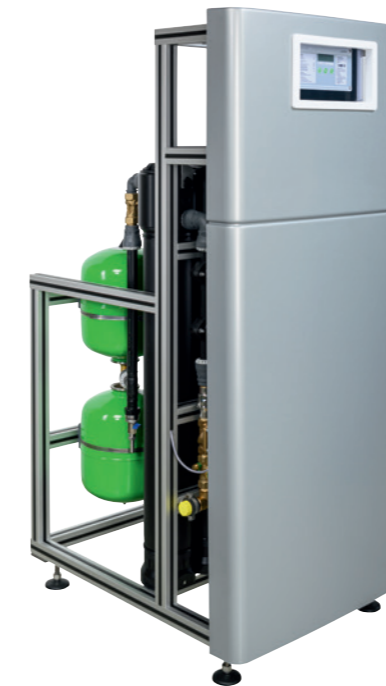
Ultrafiltrationsanlage ultraliQ:SB2000 mit Frontverkleidung