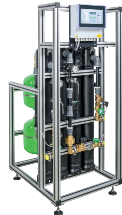
Ultrafiltrationsanlage ultraliQ:SB2000 ohne Frontverkleidung

Die Ultrafiltrationsanlage ultraliQ entfernt alle ungelösten Schmutzstoffe aus Ihrem Wasser und reduziert mikrobiologische Belastungen wie Bakterien, Viren und Parasiten. Dafür sorgt das Herzstück der Anlage: die Filtermembranen mit einer Trenngrenze von 0,02 µm.